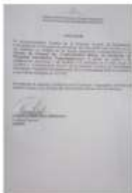
CONSTANCIA DGME.jpeg 97K

Modificacion de PACC 2021(Segunda Modificacion).pdf