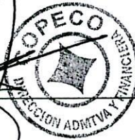
Vo.Bo. Director Administrativo y Financiero